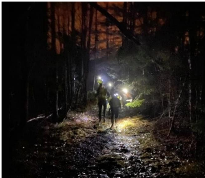
Pannlampslöpning med barngruppen hösten 2020

Även barngrupperna har kört på utomhus under hösten. Normalt brukar de gå in i oktober men i höst är det ute som gäller och det har fungerat bra.