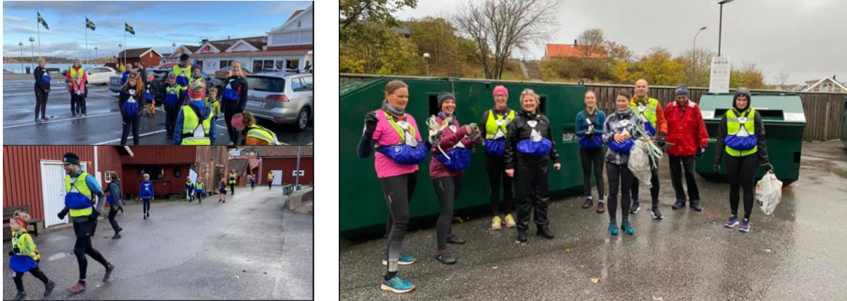
Plogging i Väjern och i Bovallstrand

Under Hållbarhetsfestivalen i oktober arrangerade Sotenäs kommun tillsammans med IK Granit och Västkuststiftelsen två plogga-event. Ett med start i Väjern och ett i Bovallstrand. Välbesökt men tyvärr mycket skräp.